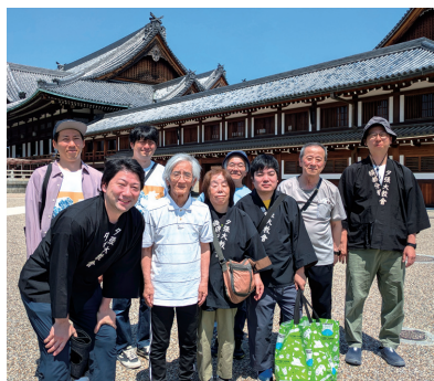
5月本部廻廊ひのきしん