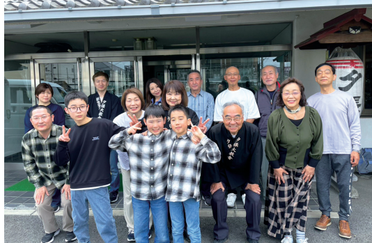
団参をされた各教会。左上から時計回りに。祝梅、幌都、上富良野、峰延【4月】、志加ノ谷