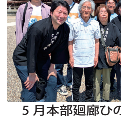
開始前のおつとめ