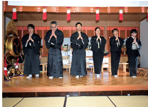
勇んだおつとめが勤められた

初夏の青空が広がった5月30日、栗沢の清真布分教会で会長就任奉告祭が執り行われた。新任を祝つて、大教会長夫妻、前奥様、南空知支部長、来賓、大勢の教友、町内の方々が参集下して、勇んだおつとめが勤められた。